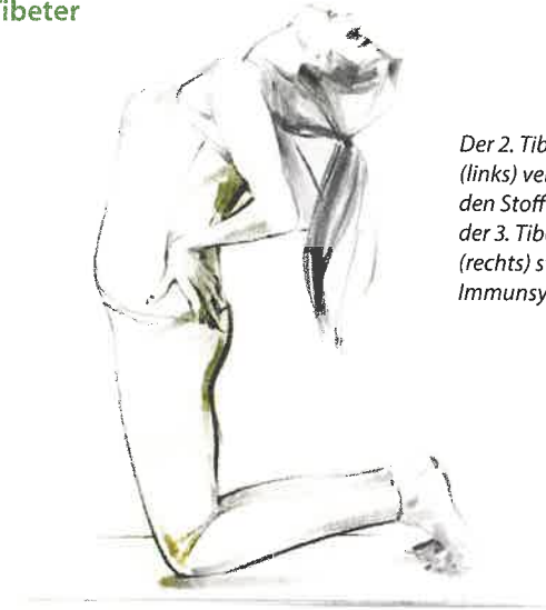
Der 2. Tibeter (links) verbessert den Stoffwechsel, der 3. Tibeter (rechts) stärkt das Immunsystem

Ausführung: Legen Sie sich mit dem Rücken auf eine Yogamatte oder einen dicken Teppich und strecken Sie die Beine aus. Die Arme liegen seitlich neben dem Körper, die Handflächen zeigen nach unten. Atmen Sie nun tief