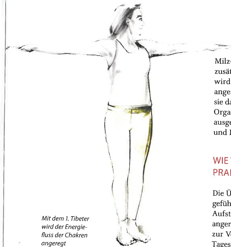
Mit dem 1. Tibeter wird der Energiefluss der Chakren angeregt

Der 1. Tibeter aktiviert insbesondere das Gürtelgefäß, das wie ein Gürtel die Taille umgibt und die Meridiane miteinander verbindet. Außerdem stimuliert er das Konzeptionsgefäß (Zentralgefäß) und das Lenkergefäß (Gouverneursgefäß). Das Konzeptionsgefäß wird auch als „großer mütterlicher Strom“ bezeichnet, verläuft von einem Punkt unter der Unterlippe mittig an der vorderen Körperseite entlang bis zum Damm und verbindet die Energien aller Yin-Meridiane. Es fördert die Fähigkeit, ruhig